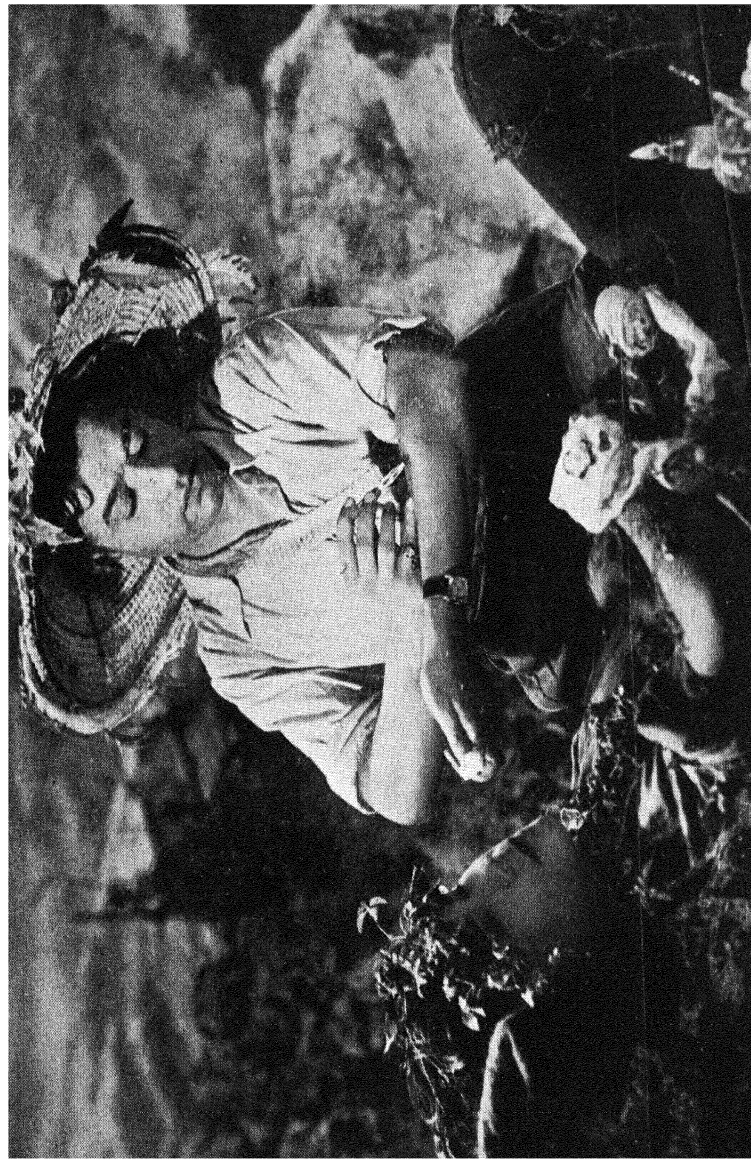
डा. कोटणीसकी श्रम कर्माती : अपने ही शरीरपर प्रयोग करके उन्होंने नयी-नयी दवाइयाँ ईजाद की । [ देखिये पृष्ठ ९४ ]